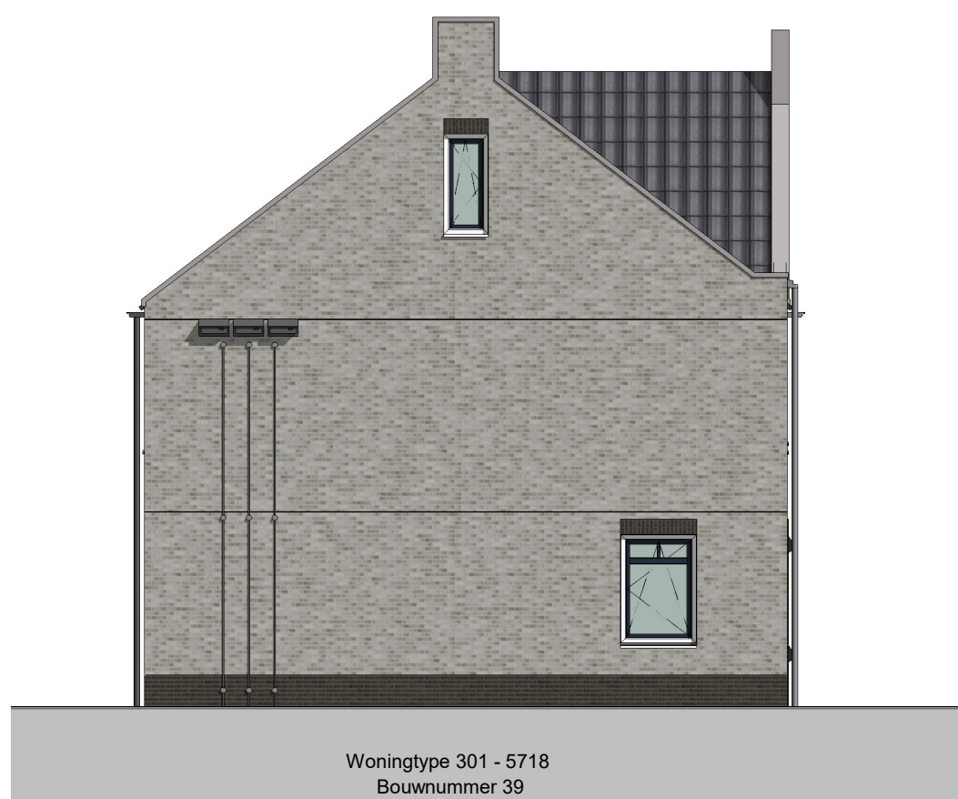
Linkergevel Nestkasten en spandraden zijn indicatief ingetekend